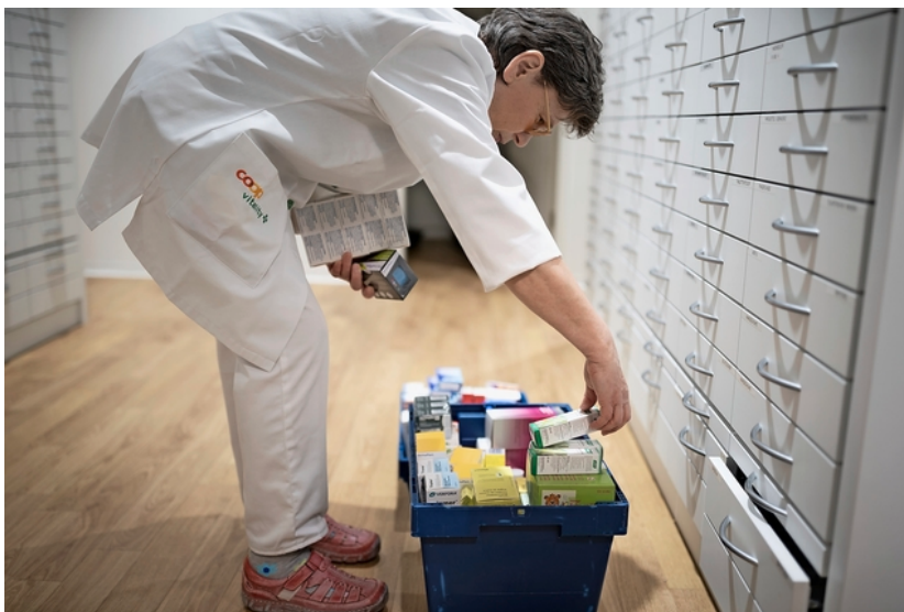
Fehlende Rohstoffe: In der Schweiz können zurzeit 630 Medikamente nicht geliefert werden.

Der Bund schlägt Alarm, weil Pharmafirmen immer mehr wichtige Medikamente nicht liefern können. Nun soll die Armeepothek Grosseinkäufe tätigen.