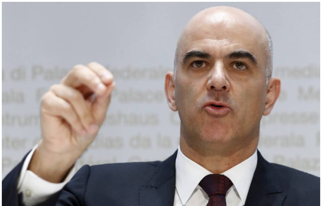
Bundespräsident Alain Berset.

von Andreas Möckli - Schweiz am Wochenende • 15.12.2018 um 04:00 Uhr